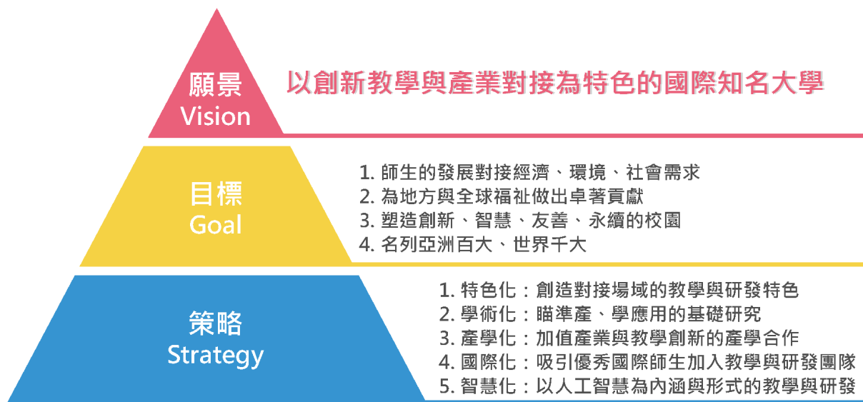
圖 1 YunTech 校務發展的願景、目標與策略

YunTech 的永續計畫衍生自校務中程發展計畫。本校 2022~2026 年度中程發展計畫（參圖 1），是以「以創新教學與產業對接為特色的國際知名大學」為願景，以師生的發展對接經濟、環境、社會需求、為地方與全球福祉做出卓越貢獻、塑造創新、智慧、友善、永續的校園、以及名列亞洲百大、世界千大為目標，並以(1)特色化：創造對接場域的教學與研發特色，(2)學術化：瞄準產、學應用的基礎研究，(3)產學化：加值產業與教學創新的產學合作，(4)國際化：吸引優秀國際師生加入教學與研發團隊，(5)智慧化：以人工智慧為內涵與形式的教學與研發等五化為發展策略。當中揭示了經濟、環境、社會永續在學校未來發展中的重要性。